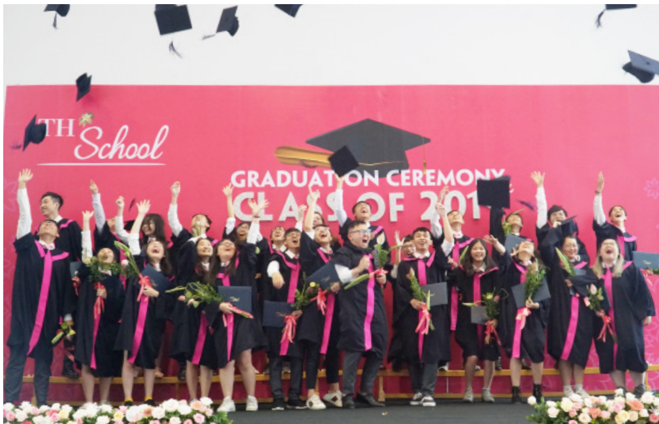
Khoảnh khắc các em học sinh khóa K2 chính thức tốt nghiệp trường TH School.

Chiều ngày 27/5, Lễ tốt nghiệp khóa K2 TH School đã diễn ra trong không khí xúc động và tự hào. 27 em học sinh với thành tích học tập xuất sắc đã chính thức tốt nghiệp chương trình phổ thông trung học để bước vào giảng đường đại học.