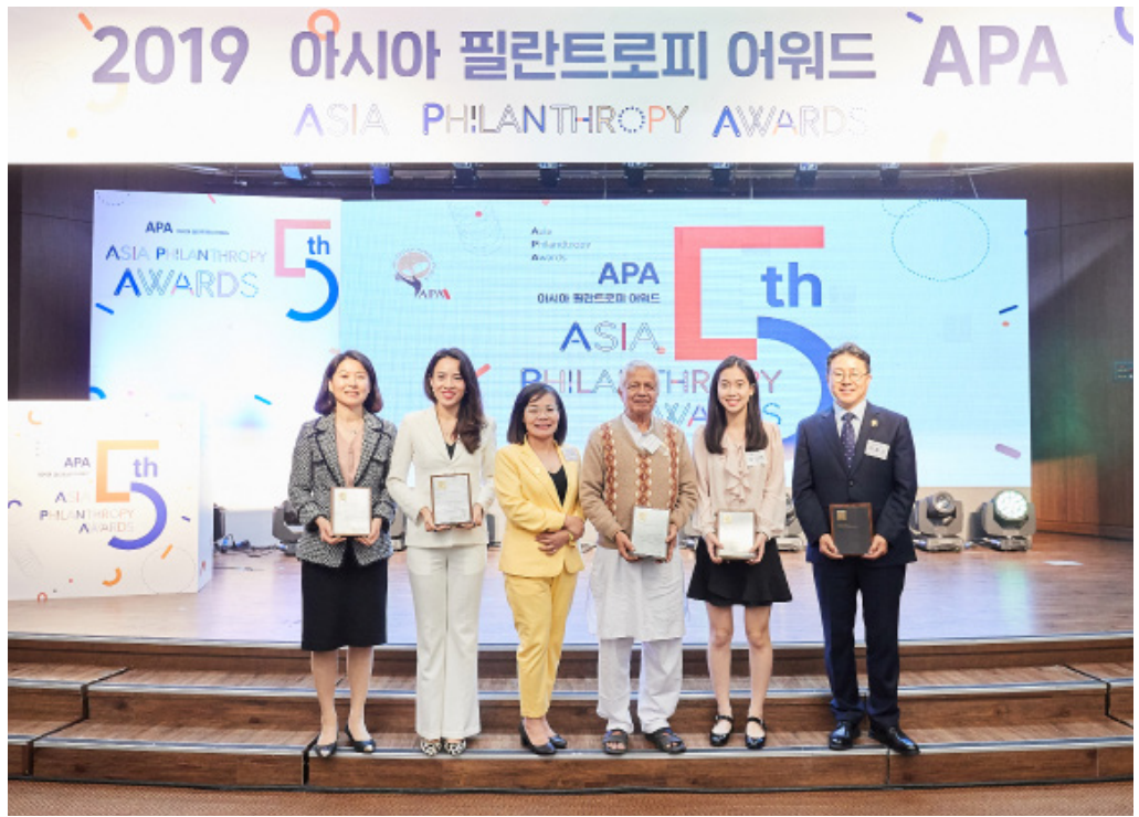
Đại diện Quỹ VTVV (thứ hai và ba từ trái sang) chụp ảnh kỷ niệm cùng các cá nhân nhận giải thưởng.

Ngoài hạng mục nói trên, APA 2019 còn trao 4 giải thưởng khác, bao gồm: Giải thưởng cá nhân có nhiều cống hiến cho hoạt động thiện nguyện; Giải thưởng thanh niên vì cộng đồng; Giải thưởng cá nhân có thành tích gây quỹ; Giải thưởng người nổi tiếng có cống hiến với hoạt động thiện nguyện.