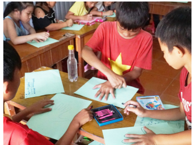
Hoạt động vẽ bàn tay và xác định những ai có thể hỗ trợ các em.