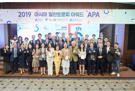
Ảnh trang bìa: Quỹ Vì Tâm Vóc Việt vinh dự nhận giải thưởng “Tổ chức phi lợi nhuận xuất sắc nhất của năm” tại Asia Philanthropy Award 2019 (Seoul, Hàn Quốc).

Năm 2019 đánh dấu 5 năm hoạt động của Quỹ. Thật ý nghĩa khi dấu mốc này được ghi nhận bởi giải thưởng cao quý - “Tổ chức phi lợi nhuận xuất sắc nhất của năm” do Asia Philanthropy Award 2019 trao tặng tại Hàn Quốc vào tháng 4/2019.