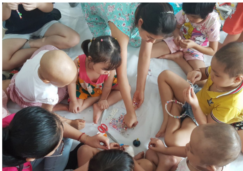
Đa phần bệnh nhi tại Bệnh viện K nằm điều trị dài ngày, các em thường góp đồ chơi cùng chơi với nhau nhưng ít khi đông vui như hôm nay.

Hoạt động từ thiện trao tặng sữa dinh dưỡng cho trẻ truyền hoá chất này đã diễn ra tròn một năm, với sự chung tay của rất nhiều cá nhân. Quỹ VTVV mong muốn kéo dài hoạt động ý nghĩa này, mang thêm những ly sữa giúp bổ sung dinh dưỡng cho những em nhỏ trong quá trình chiến đấu với bệnh tật. Quỹ VTVV chào đón mọi hình thức ủng hộ cho Chương trình Sữa dinh dưỡng cho trẻ truyền hóa chất: Trực tiếp tham gia trao tặng sữa, quyên góp tiền mặt/sản phẩm, mua sản phẩm ủng hộ thông qua hoạt động gây quỹ “Phiên chợ từ thiện online” trên fanpage của Quỹ VTVV, hay đơn giản là hãy chia sẻ thông tin này đến mọi người!