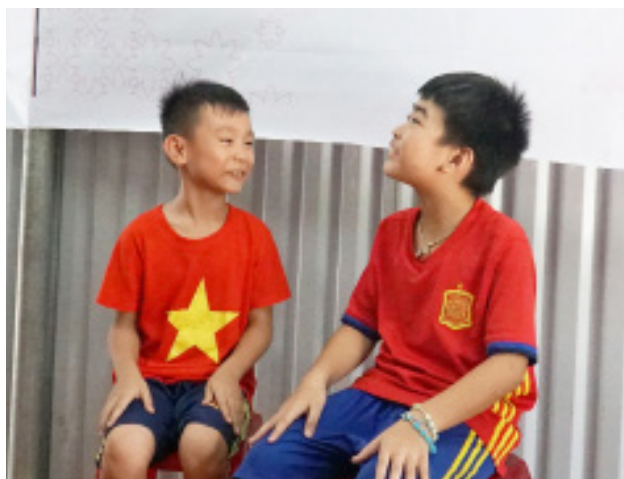
Các em đóng kịch thực hành giải quyết tình huống phòng chống xâm hại tình dục trẻ em.