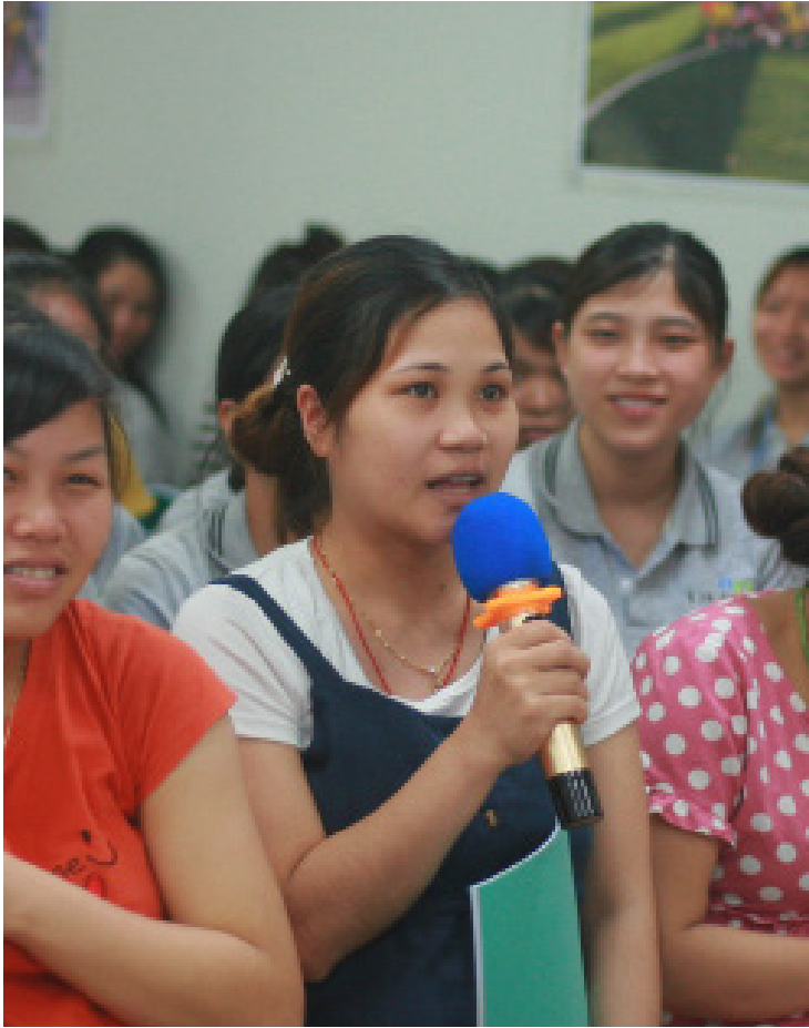
Lao động nữ trong độ tuổi sinh sản đặc biệt quan tâm đến nội dung truyền thông của dự án về chăm sóc dinh dưỡng cho phụ nữ trong và sau khi mang thai, cũng như dinh dưỡng cho trẻ trong 1.000 ngày đầu đời.

thị xã hội thuốc tránh thai và bao cao su tại các nhà máy, góp phần tăng cường cơ hội của NLD trong việc tiếp cận với BCS và thuốc tránh thai có hiệu quả cao, an toàn, với giá cả hợp lý.