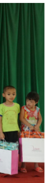
hi năm học cho

Quỹ VTVV, với mong muốn cải thiện thể chất và trí lực của trẻ em Việt Nam, rất vui được hỗ trợ và nhìn thấy các em học sinh tiến bộ hơn sau một năm học, sẵn sàng hòa nhập với môi trường sống và học tập ở địa phương. Đồng hành triển khai dự án, chúng tôi hiểu được và cảm phục sự nhiệt tình và chia sẻ những khó khăn của các thầy cô và các cô quản sinh tại trung tâm trong việc giáo dục kỹ năng và chăm sóc sức khỏe cho các em học sinh khuyết tật.