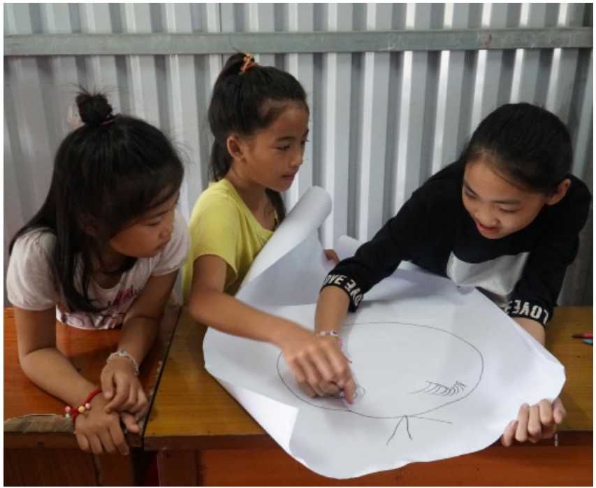
Để truyền tải thông điệp “Hãy tôn trọng! Đây là cơ thể tôi!”, tập huấn viên hướng dẫn các em thực hiện hoạt động vẽ tranh để xác định những vùng cấm trên cơ thể.

Xóm Chài bên bờ sông Lạch Tray, TP. Hải Phòng có 26 hộ dân, sinh sống tại đây gần 30 năm. Người dân tại xóm Chài đều là người lao động chân tay. Họ gặp nhiều khó khăn trong sinh hoạt cũng như tiếp cận các dịch vụ xã hội do không có đất định cư. Trong 26 hộ gia đình đang sinh sống, có 30 cháu dưới 18 tuổi nhưng chỉ có 15 cháu còn đi học.